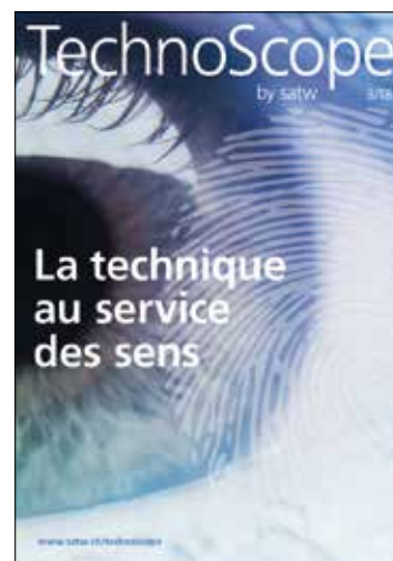
Éditions de Technoscope parues en 2018: «La technique dans le sport», «En route! Technique et mobilité» et «La technique au service des sens».