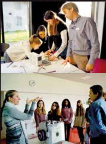
Impressions de la TecNight qui a eu lieu à Sarnen le 23 janvier.